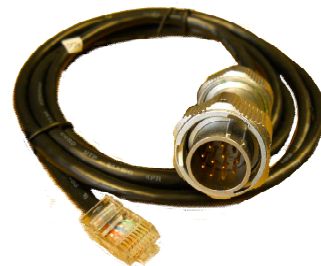
CAVO ETHERNET L = 160 cm