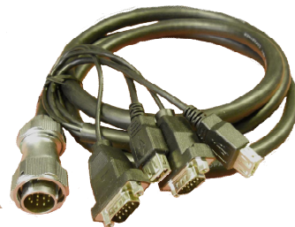
CAVO USB + SERIALI L = 160 cm