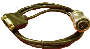
CAVO VGA L = 160 cm