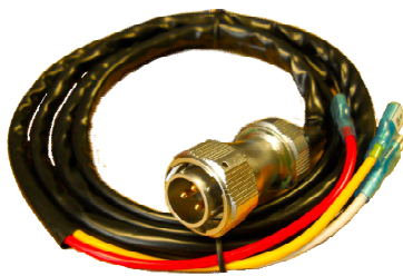
CAVO ACCENSIONE L = 160 cm